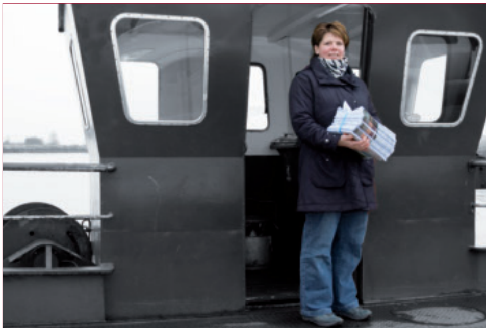
Kranten voor de overkant worden bij het Olsterveer afgeleverd en later op de dag – na zestig keer heen en weer te zijn gevaren – door de bezorgers opgehaald.

In week 28 vertelt CDA-politica Sabine Uitslag haar verhaal over het pontveer. Het kamerlid woont in Welsum, ze maakt