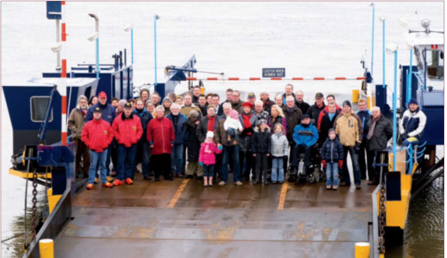
Alle voor het boek geïnterviewden op het pontje.

Dagelijks maken zo'n 800 mensen gebruik van het Olsterveer, de veerdienst over de IJssel tussen Olst en Welsum.